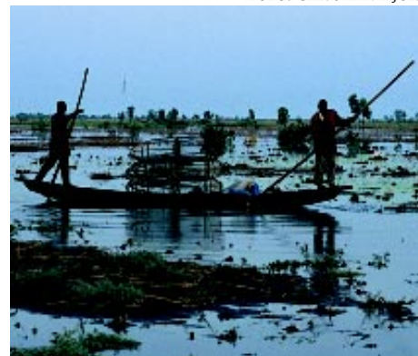
Vattnet stiger. Mindre än en meters höjning kan förskjuta Tchadsjöns strandlinje många kilometer.

år åter stigit och successivt dränkt vidsträckta områden av buskskog som under 25 års torka etablerats på den tidigare sjöbotten.