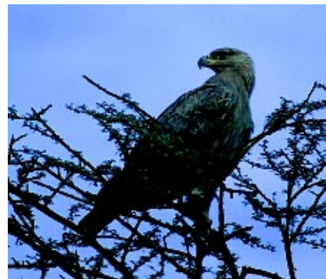
Savannörn Aquila rapax vid Tchadsjön.